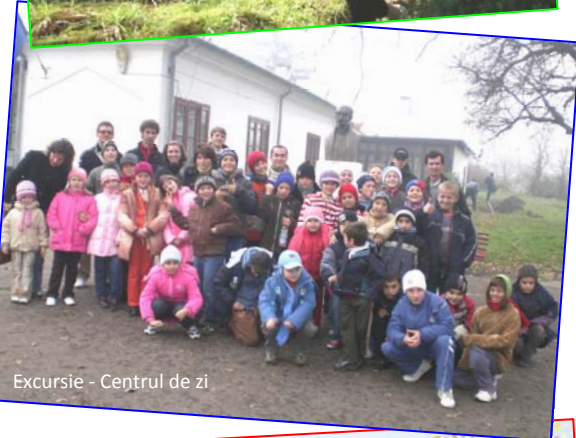
Excursie - Centrul de zi