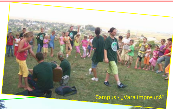
Campus - „Vara împreună”